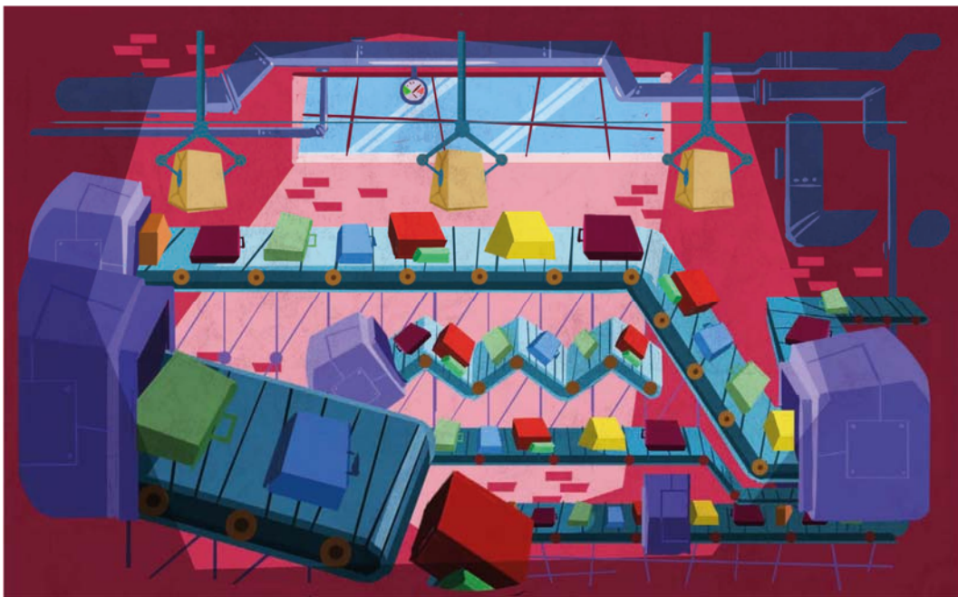
Salle des bagages

Les codes couleurs de l'image concernant les espaces seront en partie influencés par l'univers esthétique et coloré du clown. Par opposition, les personnages véhiculant les peurs ataviques s'inscriront sur des dégradés de noir avec le rouge comme unique couleur